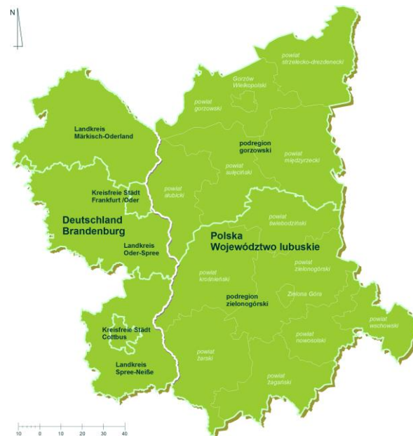
Abbildung 1: Übersichtskarte des Fördergebiets Rysunek 1: Mapa poglądowa obszaru wsparcia